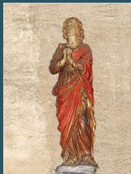
Tesserete (Capriasca), Santo Stefano