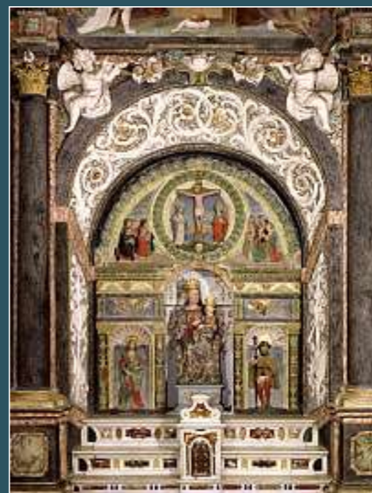
Campione d'Italia, Santa Maria dei Ghirli