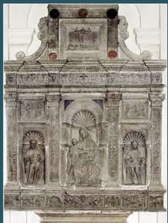
Vico Morcote, Santi Fedele e Simone