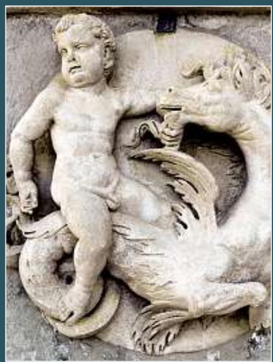
Lugano, San Lorenzo (cattedrale)