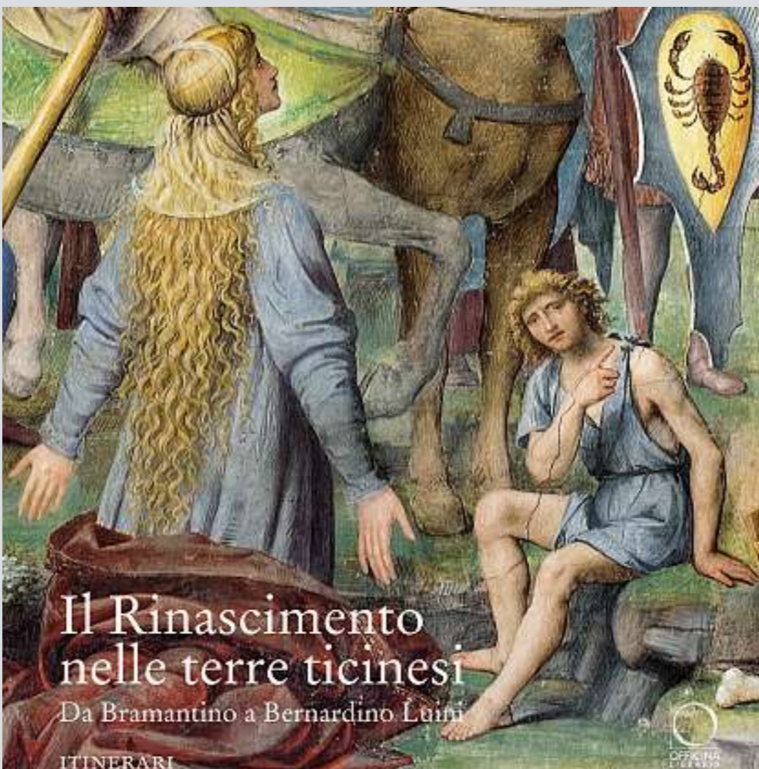
Lugano, Santa Maria degli Angeli

È tradizione ormai piuttosto consolidata quella di affiancare il catalogo di una mostra con un volume di itinerari che diano conto delle opere d'arte diffuse sul territorio che non si è potuto portare in mostra essendo affrescate, poiché delicate o perché intransportabili. Si tratta di un modo per far comprendere quale sia il contesto che ha generato i capolavori esposti e per valorizzare il patrimonio artistico del territorio. Se ben fatti, si tratta di strumenti utili anche oltre la conclusione della mostra. Quella che risulta eccezionale in questo caso è la cura messa nel realizzare il volume che, contrariamente a quanto avviene di solito, non è un opuscolo, figlio di un dio minore rispetto al catalogo della mostra, ma ne è un vero alter ego, che lo completa sullo stesso piano d'importanza. Si tratta di una scelta significativa che sigilla gli studi condotti per realizzare questa mostra e stabilizza le rivoluzioni conoscitive messe a punto grazie agli studi stessi. Un volume di itinerari, arricchito da due scritti: un'introduzione di carattere storico firmata da Giuseppe Chiesi e un saggio sull'architettura di Nicola Soldini, ma non solo. Attraverso questo agile volume - che ogni ticinese dovrebbe avere non sul comodino, ma sul ripiano vicino alla porta, sempre pronto da tirar su insieme alle chiavi e alle sigarette prima di uscire - 25 luoghi tipici del Ri-