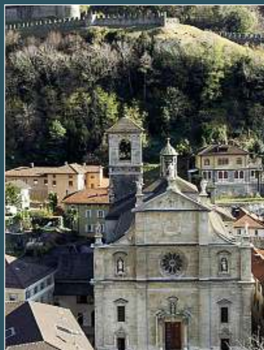
Bellinzona, Santi Pietro e Stefano (collegiata)