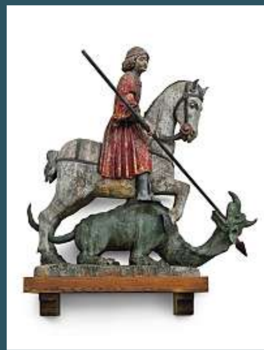
Losone, San Giorgio