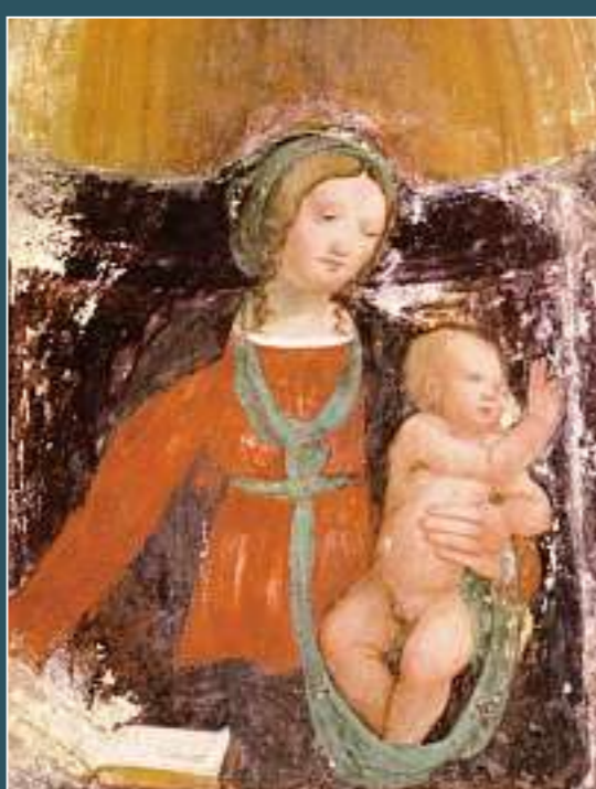
Muralto, Santa Maria Annunziata