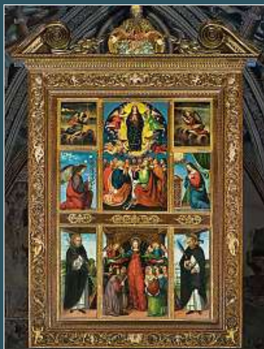
Ascona, Santa Maria della Misericordia