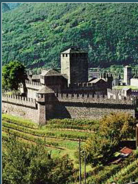
Bellinzona, Castelli (Castelgrande, Montebello e Sasso Corbaro)