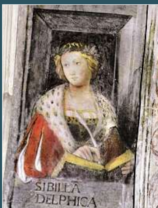
Morcote, Santa Maria del Sasso