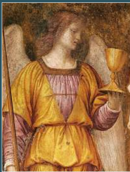
Dino (Sovico), San Nazario