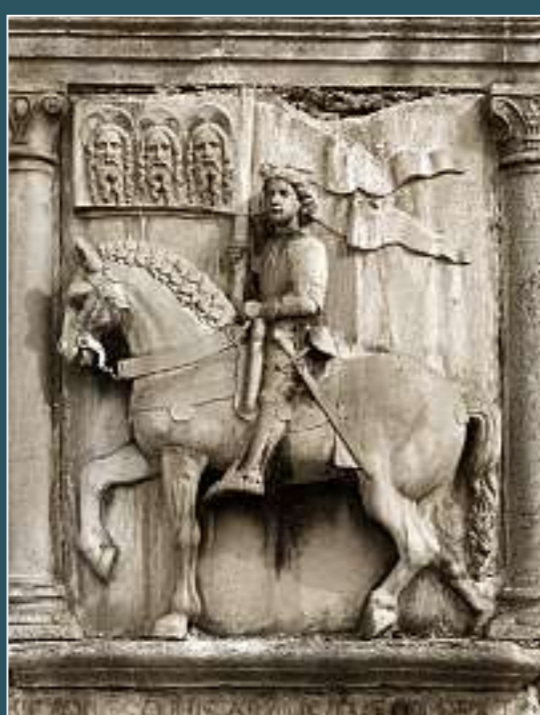
Muralto, San Vittore