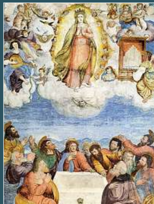
Brissago, Santa Maria in Selva di Ponte e Santi Pietro e Paolo