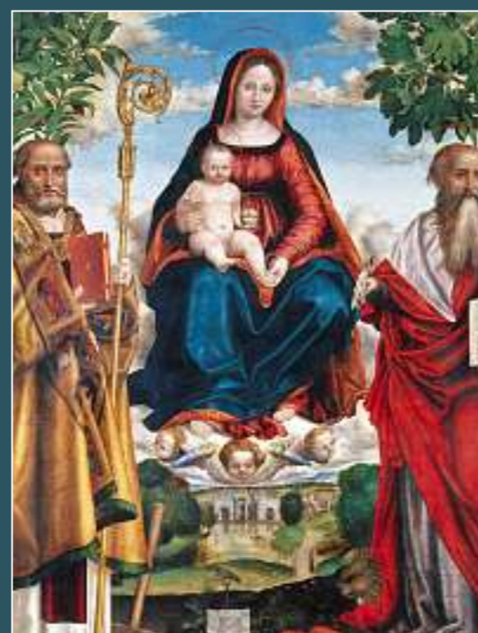
Ravecchia (Bellinzona), San Biagio