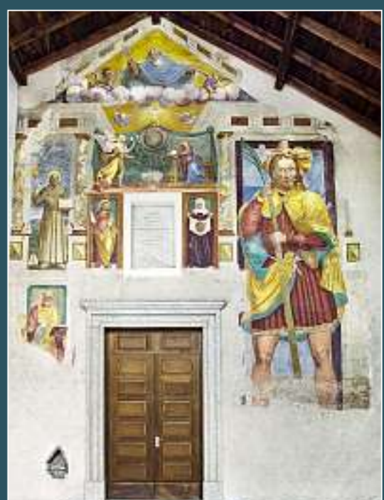
Monte Carasso, Santi Gerolamo e Bernardino