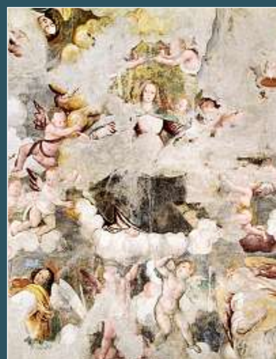
Magliasina (Caslano), Cappella della Beata Vergine