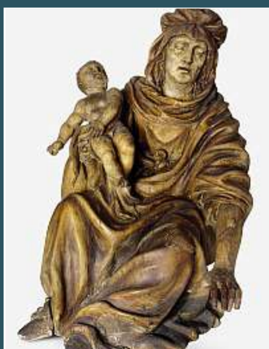
Lugano, Santa Maria di Loreto

PINACOTECA ZVST Rancate (Mendrisio) Canton Ticino, CH «Il Rinascimento nelle terre ticinesi» Per gli abbonati GdP, presentando GdPCard, sconto di Fr. 2.- sul biglietto d'ingresso e 10% di sconto sul catalogo. Info: tel. 091 816 47 91 - www.ti.ch/zuest