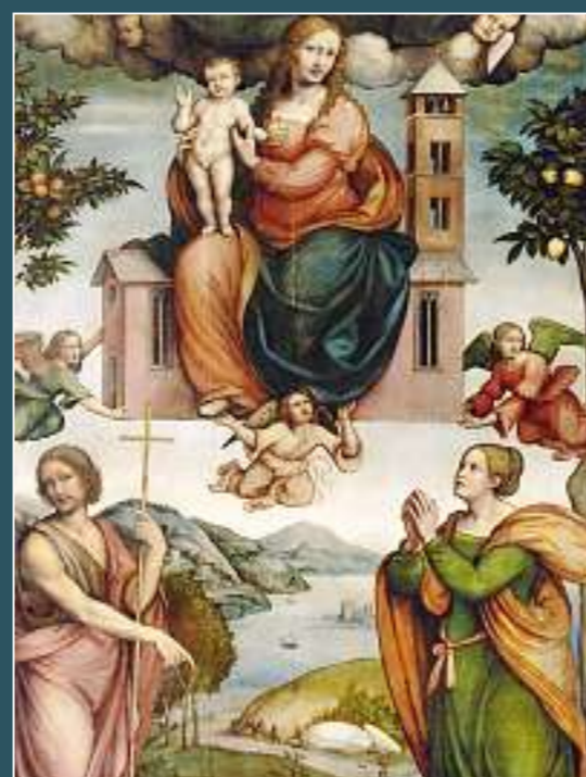
Ponte Capriasca, Sant' Ambrogio