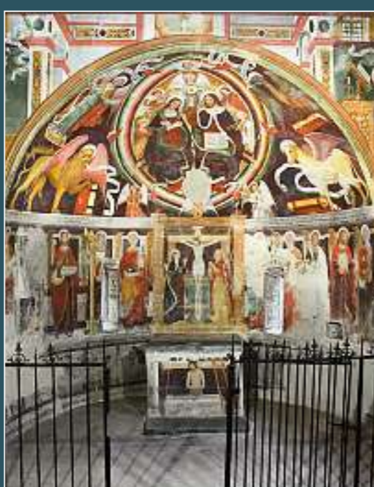
Maggia, Santa Maria delle Grazie o di Campagna