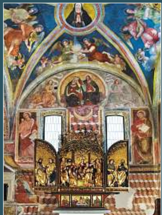
Chiggiona (Faido), Santa Maria Assunta