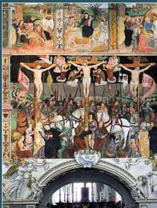
Bellinzona, Santa Maria delle Grazie